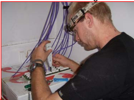
Gelukkig kregen de technische mannen alles op tijd aangesloten!

Op de computers staat ook andere software. Zo is er een programma dat studenten zelfstandig door kunnen lopen om alles over anatomie te weten te komen. Datzelfde geldt voor biologie en fysiologie.