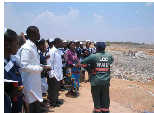
De studenten krijgen uitleg op de vuilnisbelt.

Studenten moeten daarnaast weten welk belang hygiëne heeft bij bedrijven. Ze zijn daarom op bezoek geweest bij Zambeef, het slachthuis van de grootste vleesproducent in Zambia, de waterzuivering en de vuilnisbelt.