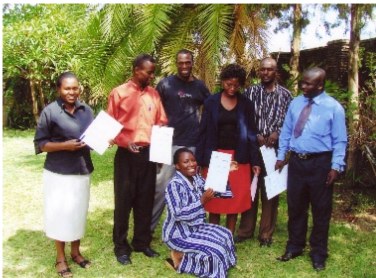
Docenten en klinisch instructeurs van het LHI, met hun certificaat van de training.

Op vrijdagmiddag was er een certificaat-uitreiking voor docenten en instructeurs samen. Dit was een feestelijk gebeuren waarbij het hele team van de school aanwezig was. + + +